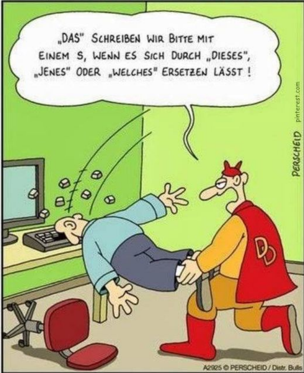
RECHTSCHREIBWOCHE MIT DOKTOR DUDEN, TAG EINS